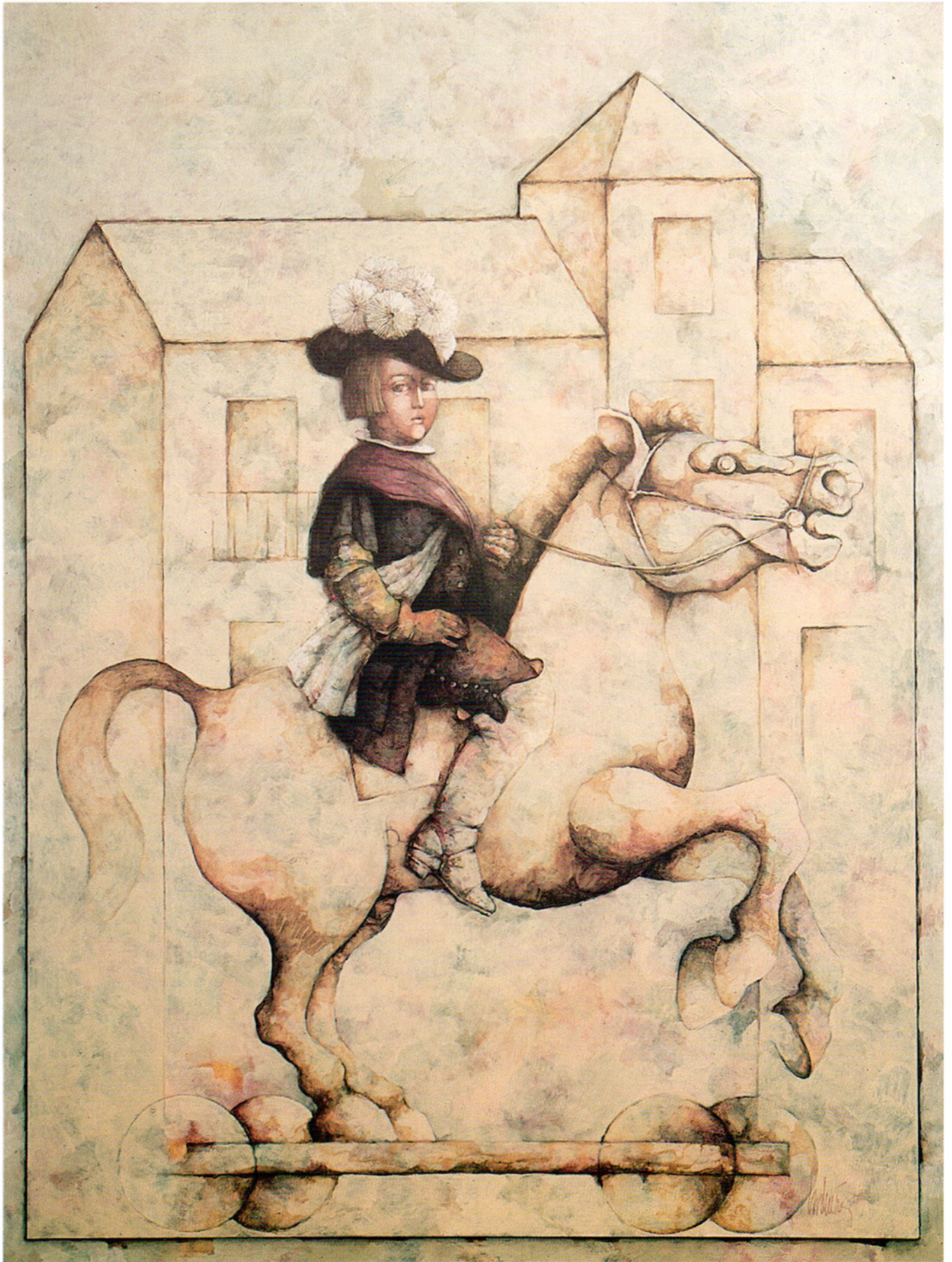
Baltasar Carlos en el picadero

Oleo y acrílico sobre tabla 131 x 97 cm. 1998